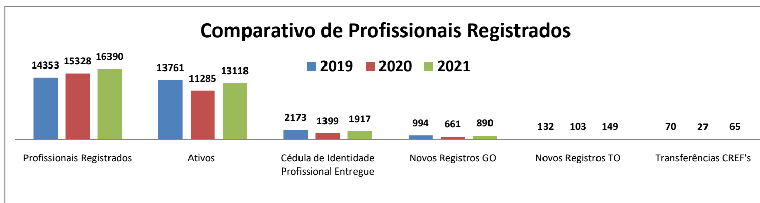
Gráfico 01 – Comparativo de Profissionais Registrados