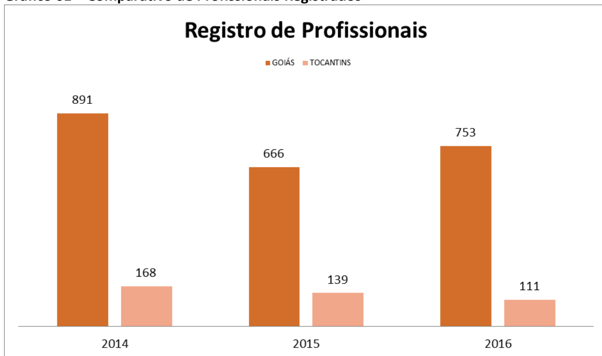
Gráfico 01 – Comparativo de Profissionais Registrados